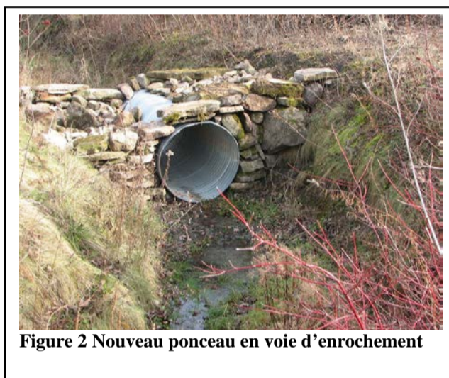
Figure 2 Nouveau ponceau en voie d'encrochement

Un ponceau a été installé pour traverser le ruisseau Foran du côté ouest (Figure 2). Le sentier a été prolongé selon le tracé hachuré, visible sur la carte de la figure 1, sur une distance de 1.3 kilomètre jusqu'à l'autre traversée du ruisseau Foran, du côté est, où il nous faudra installer un autre ponceau.